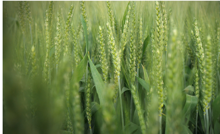
פרט מתוך עבודת וידאו

וגבורה תמלא ואור חדש בציון יבשר כי כלנו מאירים מאורו.